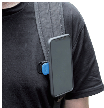
(参考)バックパックの肩ひもへの装着例

2. 45° の角度で上から軽く押しあて、レバーがさがったら、縦または横のお好みの向きにまわすとロックされます。取り外す際には、レバーを押しながら、再度45° にまわすとスムーズに取ることができます。